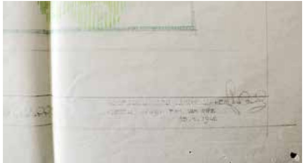
Voorontwerp uitbreiding van de begraafplaats, inclusief militair ereperk, gesigeneerd door Jean Canneel (15 januari 1942)