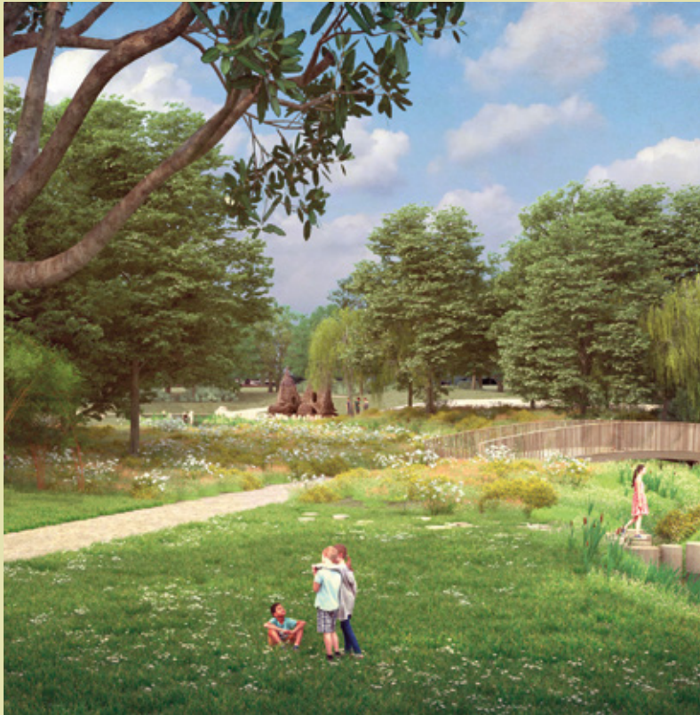
Toekomstbeeld Mullebos 2040

toegankelijk zijn voor alle gebruikers zodat iedereen van het bos kan genieten. Zo wordt Dilbeek weer een beetje meer klaar voor morgen!